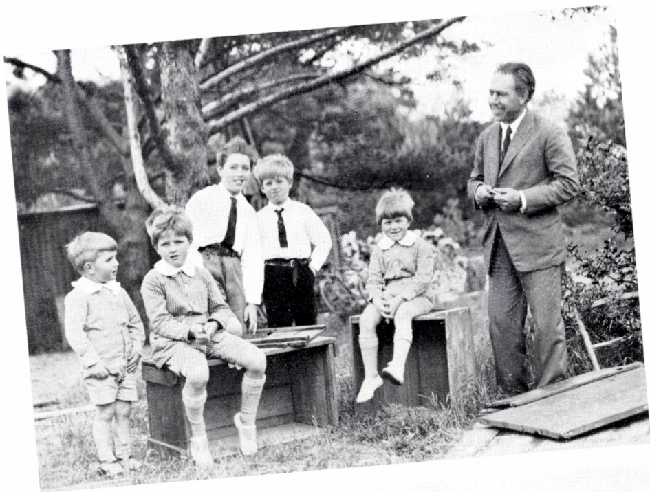
Niels Bohr med sine sønner ved sommerhuset i Tisvilde