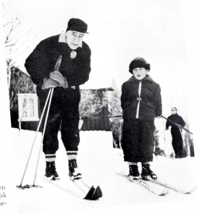
Niels Bohr, der selv var en dygtig skiløber, indvier på en ferie i Norge en sønne- søn i skisportens kunst